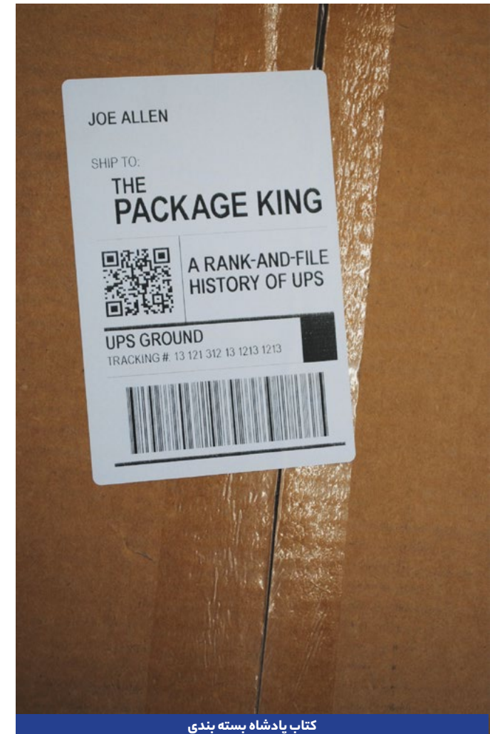
کتاب پادشاه بسته بندی

جو آلن در این کتاب در رابطه با شرکت UPS خواننده را با محتوای جدیدی روبرو می کند: شرکت معروفی که اطلاعات جسته و گریخته ای درباره آن داریم، چه ماهیتی دارد؟ شرکتی که به عنوان سرویس تحویل کالا با دوچرخه در سیاتل و واشینگتن شروع به کار کرد، چگونه تبدیل به یک غول جهانی شد؟ چگونه جایگزین جنرال موتورز، نماد سرمایه داری آمریکا شد تا به بزرگترین کارفرمای بخش خصوصی و اتحادیه ای در ایالات متحده تبدیل شود؟ و این روند صعودی، چه هزینه ای برای کارگران آن در پی داشته؟!